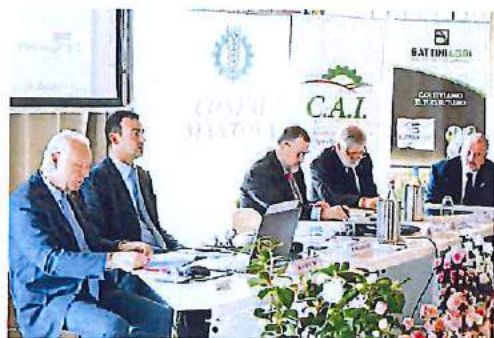
I vertici di Confal durante l'assemblea a Rivalta sul Mincio

Scenario positivo, come ha sottolineato il direttore di Confal Mantova e vicepresidente na-